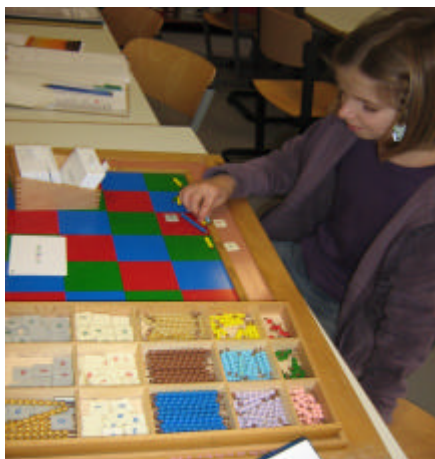
schriftliches Rechnen konkret vorbereiten