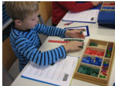
mit großen Zahlen rechnen